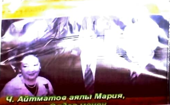
Ч. Айтматов аялы Мария, сөзгө менен